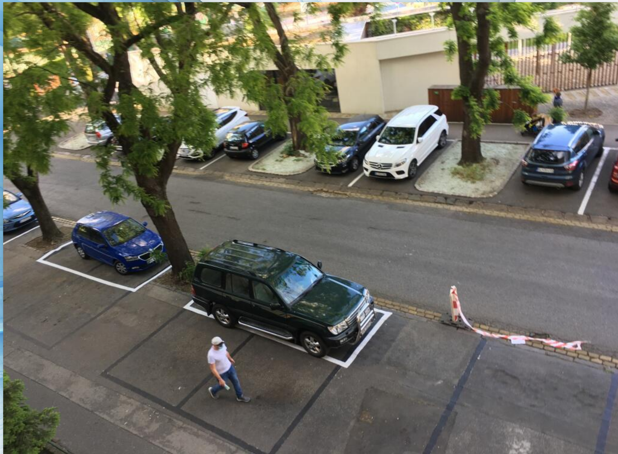
Parkovanie v Bratislavskom Novom Meste, zdroj plus 7 dní.